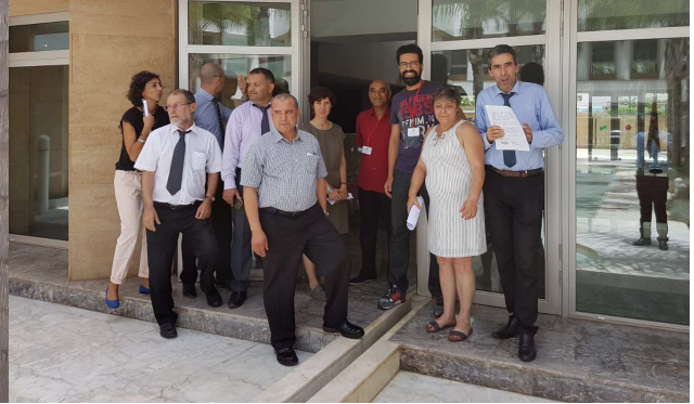
CONSULADO EN RABAT