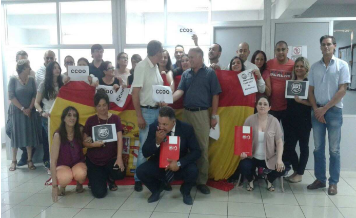
CONSULADO EN CASABLANCA