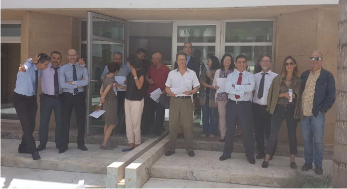
EMBAJADA EN RABAT