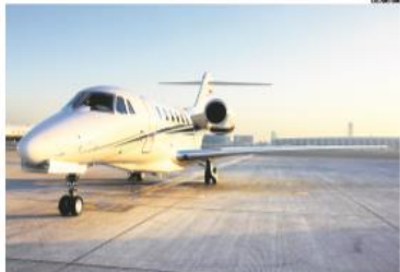
ICMS incidido no consumo de um jatinho no Estado de SP é de 8%, enquanto o de uma carne é de 12%.

Produtos básicos têm uma tributação menor do que artigos de luxo nas contas públicas. Isso mostra levantamento do Sindicato dos Agentes Fiscais de Rendas do Estado de São Paulo, o Sinafresp, que lançou ontem uma campanha de conscientização sobre o tema.