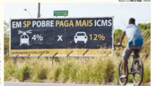
OUTDOOR Campanha de alíquotas é exibida para quem passa na marginal da rodovia Elyseu Montenegro Magalhães

ESTADO Em nota de esclarecimento, a Secretaria de Estado da Fazenda diz que a campanha traz erros, omissões e imprecisões que tem