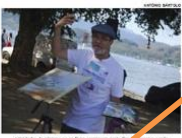
Atividade de teatro em praça pública em Araraquara

Na programação do Projeto “Arte ao Centro”, o grupo de teatro “O Teatro do Povo”, apresentará nesta sexta-feira (26) e sábado (27) o espetáculo “O Teatro do Povo”, que abordará a realidade social da cidade de Araraquara.