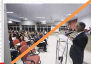
Posse da diretoria da OAB em Araraquara

A 3ª Subseção quando uma solenidade especial para a posse da diretoria da OAB de Araraquara, realizada no auditório da casa da advocacia de Araraquara, em 27 de agosto de 2016.