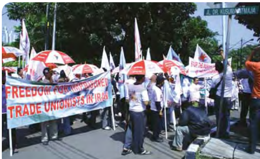
La ISP junto con afiliadas indonesias de la FITT/ITF durante una acción de solidaridad delante de la embajada de Irán en Yakarta el 9 de julio de 2010.

En India se han organizado otras campañas (por el AP Municipal Contract Workers Union), lo mismo que en Japón. Los sindicatos de Malasia llevaron a cabo un taller dedicado a examinar la Ley de