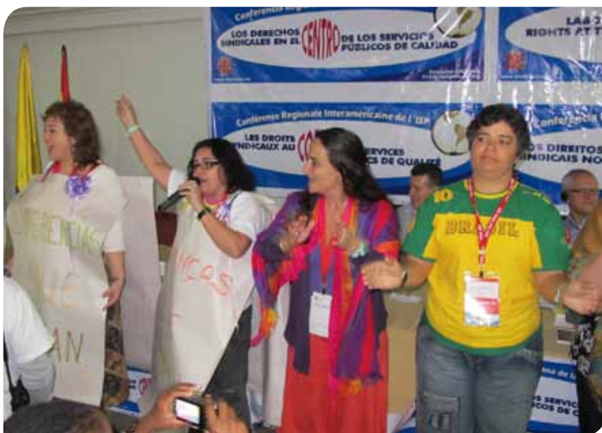
Delegados/as en la Conferencia Regional Interamericana.

Otras campañas importantes del año 2010 fueron: acciones de combate contra el racismo (incluida la tercera conferencia regional sobre el tema); la acción sobre integración de trabajadores jóvenes; la primera reunión regional sobre sindicalistas lesbianas, gay, bisexuales y transexuales, y el progreso en la equidad de remuneración. ♦