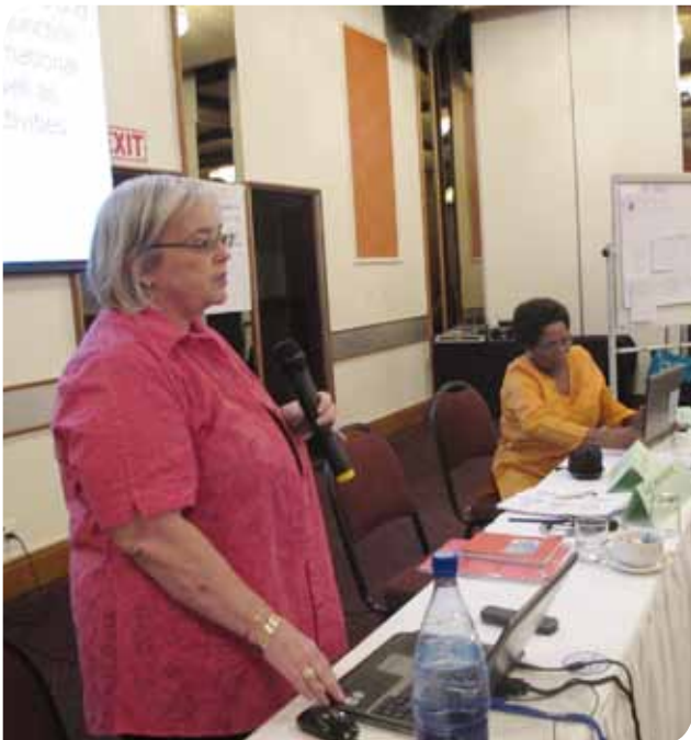
Talleres de planificación de proyectos en Sudáfrica.

En el programa se realizó también un estudio de la privatización y del empleo precario, y los resultados se aprovecharon para campañas y negociación a favor del trabajo decente. En Kenia, por ejemplo, el sindicato KETAWU está actualmente sosteniendo negociaciones