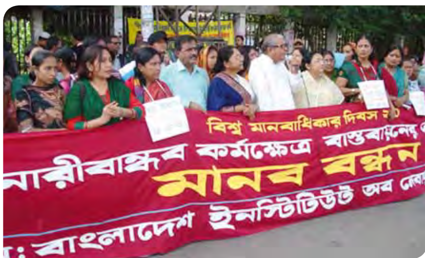
Día de los Derechos Humanos en Bangladesh.

El sindicato indonesio PLN ha venido desplegando una campaña, que actualmente sigue manteniendo, contra una nueva ley sobre privatización de la electricidad. ♦