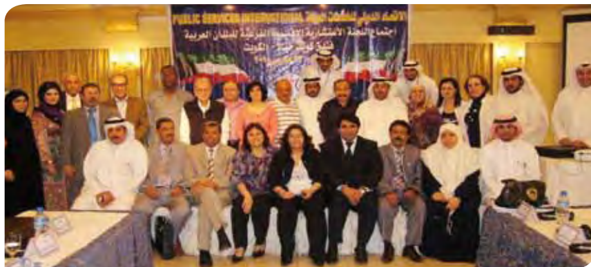
Participantes en una reunión subregional (SUBRAC) 2010.