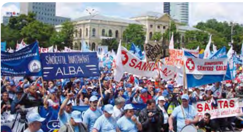
Miembros de la federación Sanitas, el 19 de mayo de 2010 en Bucarest.

Ver mayores detalles de todas las actividades, incluidos numerosos informes, en www.epsu.org . ♦