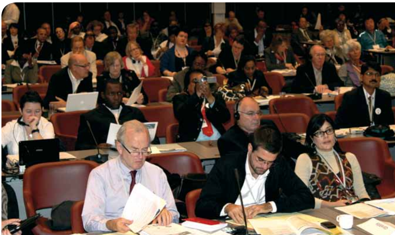
Conferencia Servicios Públicos de Calidad - ¡Pasemos a la acción!