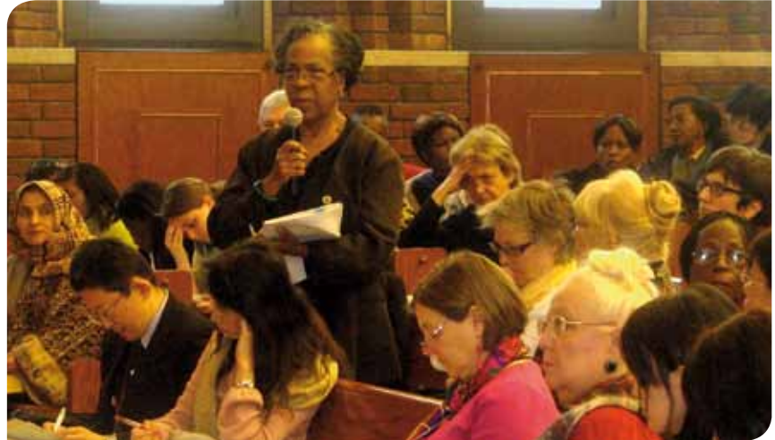
Sesión 2010 de la Comisión de la Condición Jurídica y Social de la Mujer de las Naciones Unidas: representantes de la ISP, que forman parte de la delegación sindical, participan en las reuniones de información diarias.

para los trabajadores domésticos es especialmente relevante para la ISP, dado el número creciente de trabajadores que dispensan servicios de salud a domicilio sin contar con ningún tipo de protección legal o social. La ISP respalda la adopción de una normativa sólida y global destinada a proteger a estos trabajadores, que les ofrezca unas condiciones de empleo decentes – que incluyan el derecho de sindicación y el derecho de negociación colectiva – y garantice la inclusión de mecanismos para asegurar la calidad de los cuidados suministrados en los ámbitos domésticos, entre ellos un régimen de inspección adecuado.