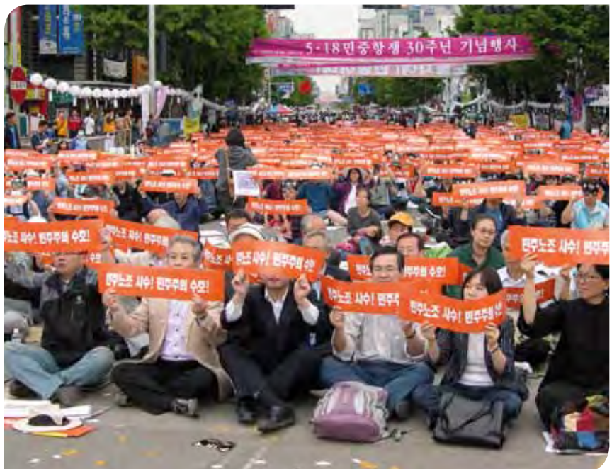
“¡Defiendan los sindicatos democráticos! ¡Protejan la democracia en Corea!”

Una delegación de la ISP visitó Suazilandia a finales de abril de 2010 para prestar apoyo a sus afiliadas que intentaban convencer al gobierno de abandonar su intención de aprobar un proyecto de ley controvertido sobre los servicios públicos.