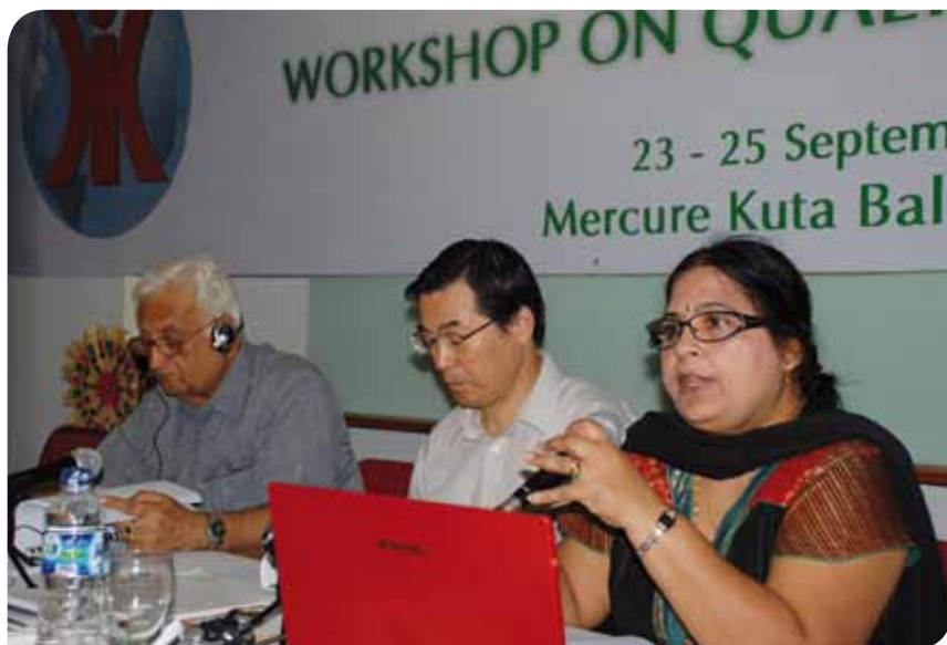
Taller sobre Servicios Públicos de Calidad.

En Indonesia, empleados de la empresa regional del agua PDAM Jaya en Yakarta, convocaron una manifestación para exigir salarios decentes. No han recibido ningún aumento desde 2003. Los trabajadores