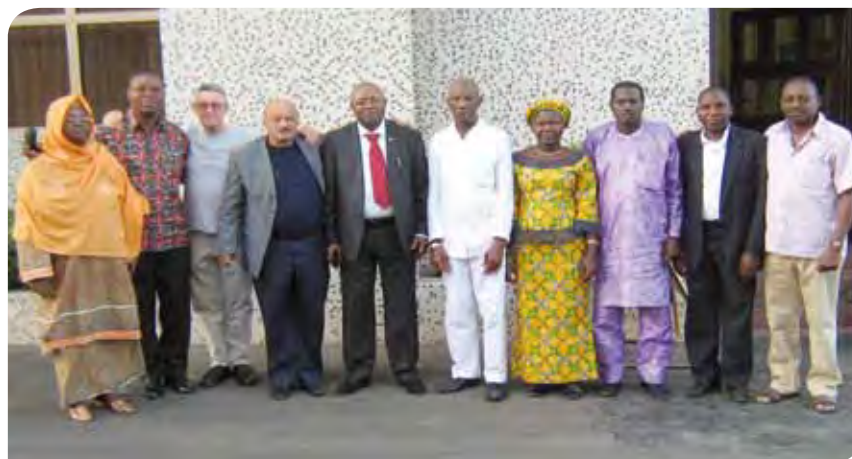
Participantes en la reunión del Grupo regional de reflexión estratégica para afiliadas de África y Países árabes.

La oficina regional ha dado apoyo financiero a las afiliadas de Senegal, Benín y África Central, contribuyendo a la financiación de sesiones de formación de dirigentes sindicales, de mujeres miembros del comité de sindicación y de jóvenes sobre los temas siguientes: diálogo social, negociación colectiva, aptitudes de comunicación, recaudación de cuotas sindicales, papel y objetivos de los comités juveniles, sindicación de jóvenes y los sindicatos y los Objetivos de Desarrollo del Milenio. ♦