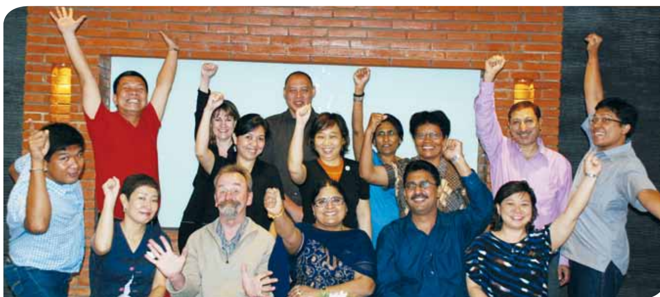
Reunión sobre un proyecto para la región Asia y Pacífico.