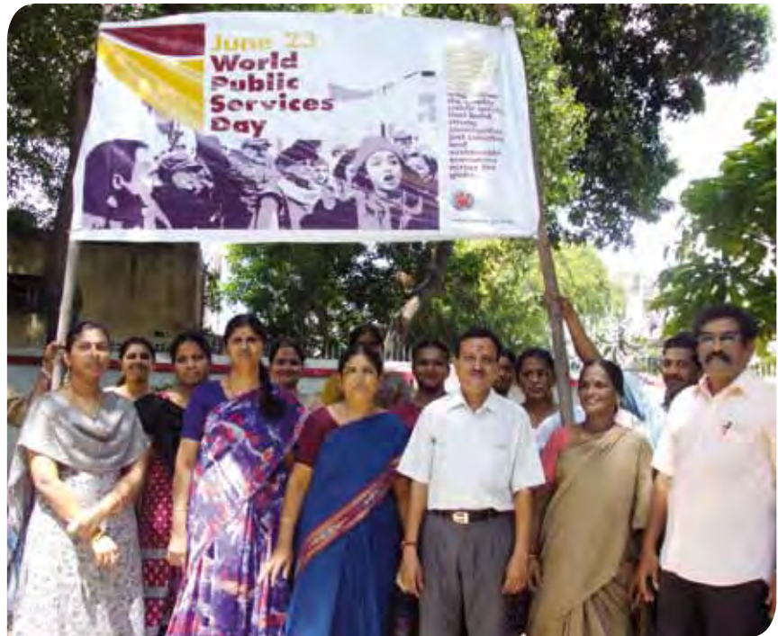
Miembros de afiliadas de la ISP en India celebran el Día Mundial de los Servicios Públicos el 23 de junio de 2010.

La primera reunión del grupo de trabajo sobre los servicios esenciales estaba inicialmente prevista para diciembre de 2010, pero un número significativo de representantes sindicales que estaban