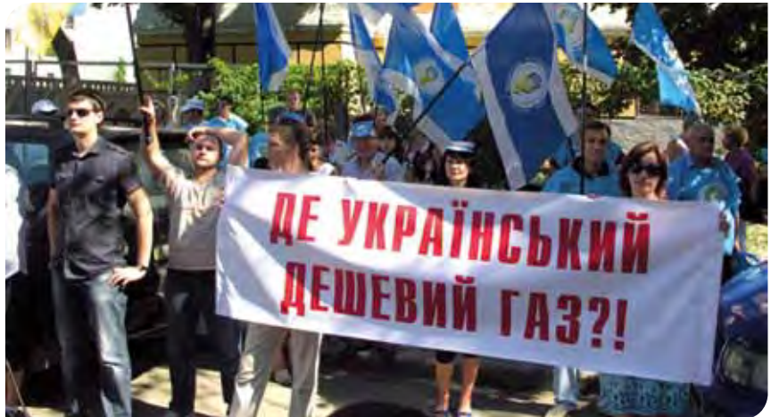
Huelguistas del sindicato de trabajadores de la salud y del sindicato de empleados públicos de Ucrania el 16 de julio de 2010.

En el ámbito europeo, la FSESP contribuyó a la consulta sobre la revisión de la Directiva sobre tiempo de trabajo. La FSESP y la Plataforma de los Empleadores en administraciones locales y regionales convinieron en una declaración conjunta en la que instan al Consejo de Europa a adoptar una perspectiva de largo plazo al coordinar sus respuestas a la actual crisis económica, y a proveer inversiones públicas para mitigar los efectos de la crisis. La FSESP abrió además formalmente el proceso de diálogo social para las administraciones gubernamentales centrales, que abarcará a 7 millones de trabajadores/-as