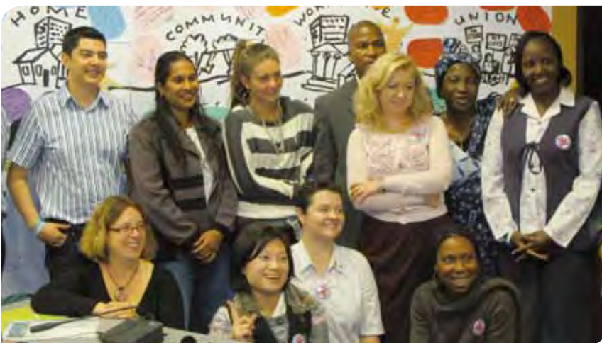
Conferencia de trabajadores/as jóvenes.

En octubre se celebró una conferencia sobre los jóvenes trabajadores, la víspera de la conferencia sobre los servicios públicos de calidad del Consejo Global Unions. Diecisiete miembros jóvenes de las afiliadas a la ISP se reunieron bajo el lema “¡Los trabajadores jóvenes son los campeones de los servicios públicos de calidad!”. Entre los temas que se discutieron se encuentran la agenda del trabajo decente y la eliminación de las barreras basadas en el género. ♦