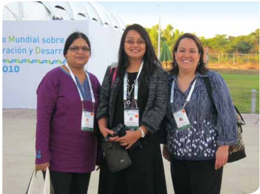
Jornadas de la Sociedad Civil del Foro Mundial sobre Migración y Desarrollo, Ciudad de México.

Las economías desarrolladas y la región de la Unión Europea siguen enfrentándose a un incremento del desempleo, a recortes en los empleos del sector público, a la congelación salarial y al deterioro de las prestaciones, según se ha anunciado en el Reino Unido, Grecia, España y Estados Unidos.