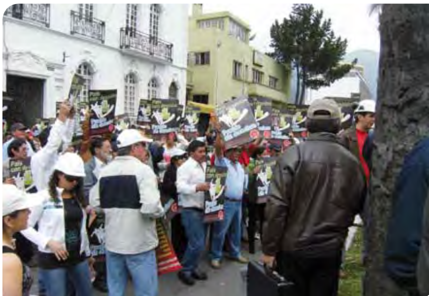
Empleados/as de la administración municipal y provincial, miembros de una afiliada de la ISP, protestan contra la supresión de sus derechos sindicales en Ecuador.

violencia cuando los policías y los soldados asumieron el control del aeropuerto de Quito y lo cerraron. Las afiliadas de la ISP FETRALME y FENOCOPRE (que representan a los empleados municipales y provinciales del gobierno) forman parte de la Coordinadora Nacional de Sindicatos del Sector Público, una coalición de sindicatos que trabaja para invertir estas medidas, utilizando entre otros los mecanismos de supervisión de la Organización Internacional del Trabajo. ♦