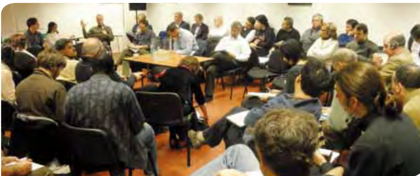
Seminario sobre el agua en Bruselas.

La ISP mantiene una presencia visible en una serie de instituciones destacadas que cuentan con un poder político y financiero en este sector. El responsable de los servicios públicos de distribución y algunas afiliadas han presentado duras críticas relativas a las políticas de privatización en la Organización de Cooperación y Desarrollo Económico, centrándose en las causas y los efectos de la crisis financiera. La ISP fue invitada a declarar ante el Experto Independiente de la Comisión de Derechos Humanos de las Naciones Unidas sobre el derecho al agua y ofreció su respaldo en la Asamblea General de las Naciones Unidas para la aprobación exitosa de una resolución sobre el derecho al agua y al saneamiento. Además, el gobierno alemán invitó a la ISP a formar parte de un comité directivo que está preparando una conferencia mundial sobre el agua, la energía y la seguridad alimentaria, diseñado en parte como una contribución a la Cumbre de las Naciones Unidas Río+20 de 2012. ♦