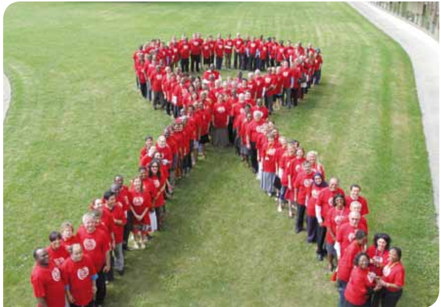
Conferencia Internacional del Trabajo de 2010 en Ginebra: Delegados/as que contribuyeron a la adopción de la nueva norma internacional laboral sobre VIH/SIDA.