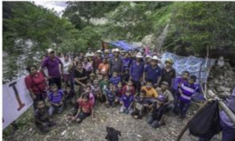
▲ Members of Copinh, the organisation headed by Berta Cáceres before she was killed.

The international funders behind the hydroelectric dam opposed by murdered Honduran environmentalist Berta Cáceres are withdrawing from the project, the Guardian can reveal.