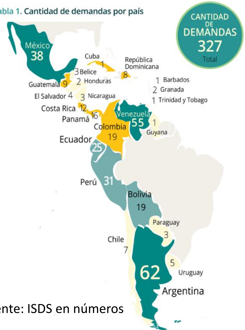
Tabla 1. Cantidad de demandas por país

Argentina, Venezuela, México, Perú y Ecuador son los países más demandados de la región. Entre ellos suman 211 demandas, lo que equivale a casi 2/3 del total de demandas contra los países de ALC.