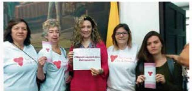
Mujeres hablaban en el Concejo para rechazar aumento del IVA para toallas y tampones.

Por: EL TIEMPO.COM y BOGOTÁ | © 4:44 p.m. 11 de diciembre de 2016